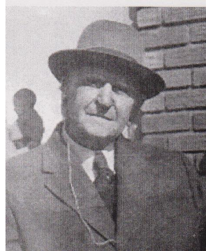
My oupa soos ek hom in die laat vyftigs en vroeë sestigs geken het