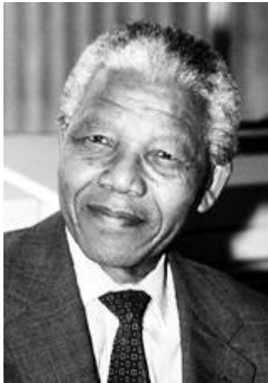
President Nelson Mandela

Na die eerste demokratiese verkiesing in April 1994 is Nelson Mandela, die President van die ANC, deur die Parlement as President verkies en op 10 Mei 1994 by die Uniegebou in Pretoria, as die eerste swart President van die Republiek van Suid Afrika, ingesweer. Weens die ooreenkoms wat tydens KODESA bereik is, is twee adjunk Presidente aangewys, naamlik Thabo Mbeki van die ANC en FW de Klerk van die Nasionale Party. Saam het hulle gedien in die nuwe Nasionale Regering van Eenheid onder die Interim Grondwet, wat onder ander verantwoordelik sou wees vir die opstel van 'n nuwe Grondwet van Suid Afrika. Alle partye wat in die verkiesing meer as 10% stemme verwerf het, is in die Nasionale Regering van Eenheid verteenwoordig.