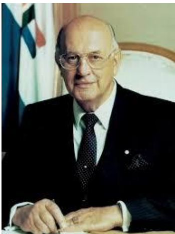
Mnr PW Botha

PW Botha is gebore op 12 Januarie 1916 op 'n plaas naby Paul Roux in die destydse Oranje Vrystaat. Hy matrikuleer in Bethlehem en studeer vanaf 1934 in die regte aan Grey Universiteitskollege, die latere Universiteit van die Oranje Vrystaat. Hy staak sy studies en word 'n Nasionale Party organiseerder in die Kaapprovinsie. Hy word in 1946 verkies as leier van die Nasionale Party se jeugorganisasie en twee jaar later word hy verkies tot die Volksraad vir die kiesafdeling, George, in die Kaapprovinsie.