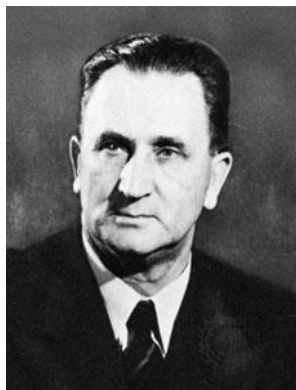
Adv JG Strydom

In 1954 het Dr DF Malan afgetree en is deur Adv JG Strydom opgevolg. Hy is egter kort daarna in 1958 oorlede en is toe opgevolg deur Dr HF Verwoerd.