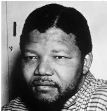
Nelson Mandela in die vroeë sestigerjare

Op 11 Julie 1963 is 19 ANC en MK Leiers, insluitend Nelson Mandela, op ‘n plaas Liliesleaf in die woongebied Rivonia in hegtenis geneem. Die aanklag teen hulle was dat hulle mense opgelei het in die voorbereiding en gebruik van plofstof en in guerrilla oorlogvoering met die oog op ‘n gewelddadige revolusie en dade van sabotasie. Asook sameswering om bogenoemde dade te pleeg en om vreemde militêre magte by te staan wanneer hulle die Republiek van SA binnedring. Asook om kommunisme te bevorder en die werf en ontvangs van fondse vir bogenoemde doeleindes van simpatiseerders in Algerië, Ethiopië, Liberië, Nigerië, Tunisië en elders.