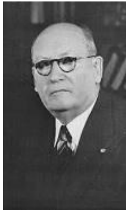
Dr DF Malan

Na 'n Loopbaan as predikant word hy in 1915 oorreed om die redakteur van die nuutgestigte "De Burger" te word, wat as mondstuk gedien het vir die Nasionale Party. In 1915 word hy die leier van die nuutgestigte Kaapse tak van die NP. In 1918 word hy tot Volksraadslid vir Calvinia verkies en vanaf 1938 LV vir Piketberg.