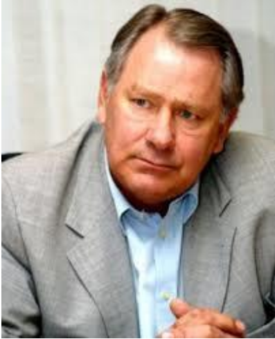
Dr Frederik van Zyl Slabbert