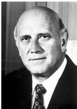
FW de Klerk

Die val van Kommunisme onder die bewind van Mikhail Gorbachev van Rusland, die implementering van die VN se Sekuriteitsraad se Resolusie 435 in Namibië op 1 April en die val van die Berlynse Muur in November 1989, het President FW de Klerk die geleentheid gegee om hervormings in Suid Afrika op 2 Februarie 1990 aan te kondig. Die ANC en ander anti-apartheid groepe is ontban en Nelson Mandela en ander leiers van die ANC sou vrygelaat word. Op 11 Februarie 1990 is Nelson Mandela uit die Victor Verster gevangenis vrygelaat. Op 21 Maart 1990 word SWA onafhanklik onder die naam Namibië. In Junie daardie jaar is die noodtoestand in Suid Afrika opgehef en die ANC het ingestem tot 'n wapenstilstand. In 1991 word hoeksteen wette van apartheid afgeskaf, naamlik die Groepsgebiedewet en die Wet op Rasseklassifikasie. Die tafel was gedek vir onderhandelings tydens die vroeë negentig jare vir 'n nuwe nie-rassige Suid Afrika.