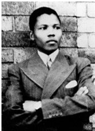
Nelson Mandela op 19 jarige ouderdom in 1937

Hy het die Metodiste Sendingskool langs die paleis bygewoon, waar hy Engels, Xhosa, Geskiedenis en Aardrykskunde geleer het. In 1933 het hy sy sekondêre skoolopleiding by Clakebury Metodiste Skool in Encobo begin, wat 'n Westerse styl inrigting en die grootste skool vir swartes in Temboeland was. Hy het sy Junior Sertifikaat in 1937 behaal en toe geskuif na die Metodiste kollege in Fort Beaufort, wat deur meeste Temboe koninklikes bygewoon is. Hier het hy sy belangstelling in die inheemse Afrika kulture ontwikkel, alhoewel die Engelse kultuur en regeringstelsel in hierdie kollege beklemtoon is. By hierdie skool het hy deelgeneem aan langafstand- atletiek en boks.