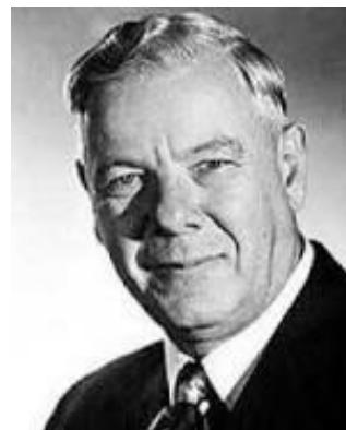
Dr HF Verwoerd