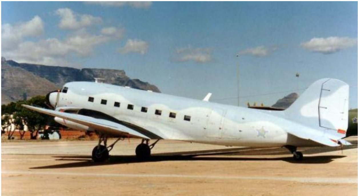
My eerste vliegtrit was in so 'n Suid Afrikaanse Lugmag Dakota DC 3