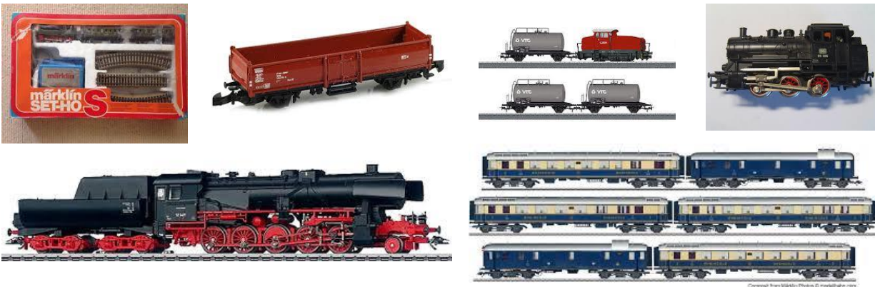
'n Basiese Märklin treinstel links bo, lokomotiewe, passasierswaens en trokke