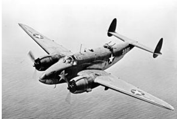
'n Lockheed PV-1 Ventura Bomwerper

Hierdie vliegtuie het verskriklik geraas weens hulle kragtige motore en omdat Ysterplaat basies langs Wingfield en Sassar was, het hulle soms laag oor Sassar gevlieg, tot groot opwinding van ons seuns en ergernis van die grootmense. Op 'n keer het 'n loods een die aand in die moeilikheid geraak en moes toe 'n noodlanding op Wingfield se aanloopbaan, wat toe al in onbruik was, doen. Soos dit maar gaan is die vliegtuig van die aanloopbaan af en het in die sand langsaan beland. Niemand is gelukkig beseer nie, maar die hele episode was baie opwindend. Die volgende dag het ons almal gaan kyk en die vliegtuig van nader besigtig. Dit was vir my verstommend hoe klein die "Cockpit" was.