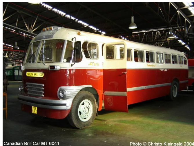
Canadian Brill Car MT 6041

Daar was vervoer vanaf Sassar tot in die stad by die Parlementsgebou en aangrensende Marksgebou, waar meeste amptenare se kantore was. Die Spoorweë het soggens twee van sy padvervoerbuse beskikbaar gestel vir vervoer van die Volksraadslede en amptenare stad toe en weer vir middagete terug Sassar toe. Na middagete weer stad toe en na werk teen 17:00 weer terug. Ons het dit as luukse busse gesien, waarvan die deur met lugdruk van binne deur die bestuurder oopgemaak is. Die banke was met sulke groen materiaal oorgetrek met sulke hoë rugleunings. As ons saam met my ma stad toe moes gaan in die middag vir inkopies het ons ook met dié busse gery. Dit was Canadian Brill Cars en was in die kenmerkende rooi en wit van die Spoorweë se padvervoerbuse.