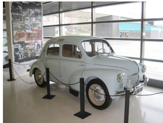
Dit was soortgelyk aan die twee hierbo, net ligblou en met 'n regter stuur !.

Die enjin (wat agter gemonteer was) se grootte was 750 cc met 'n drie-spoed hand ratkas. My pa het nie van 'n tweedeur motor gehou nie en my ma het gedink 'n VW (wat later bekend geword het as 'n Beetle) is te vinnig vir haar. Soos op die linker foto duidelik is, het al vier deure in die middel geskarnier. Wingfield was die ideale plek om te leer bestuur en my pa het my ma eers op Wingfield se aanloopbaan