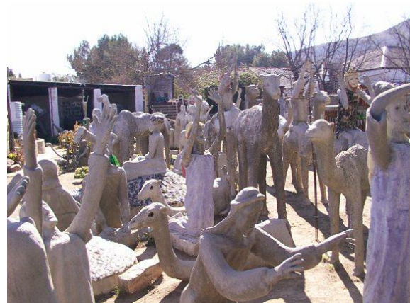
Die Uilhuis binne en buite, met al die eenaardige beelde van sement en glasstukke