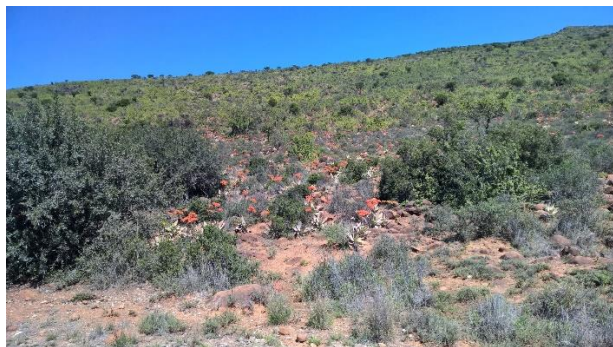
Mooi flora in die Groot Karoo