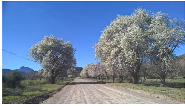
Peerboom laning net buite Nieu Bethesda

Ons verneem dat sommige mense spesiaal in September na Nieu-Bethesda kom wanneer die Peerbome bot ! Ons was toevallig daar !