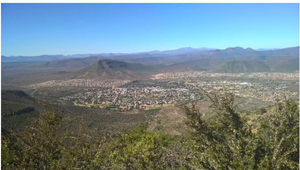
'n Mooi uitsig oor Graaff-Reinet in die bog van die Sondagsrivier vanaf die uitkyk punt