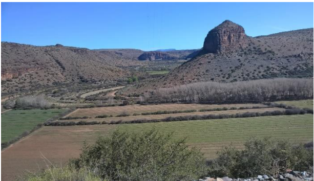
Kompassberg is 'n belangrike baken in die streek