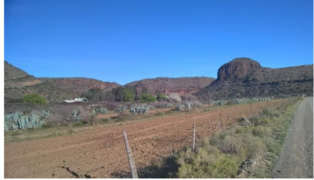
Landerye op pad na Nieu Bethesda