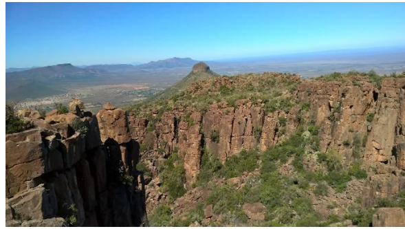
Die ruwe kolomme wat waak oor die Vallei van Verlatenheid. Regs steek Spandaukop uit